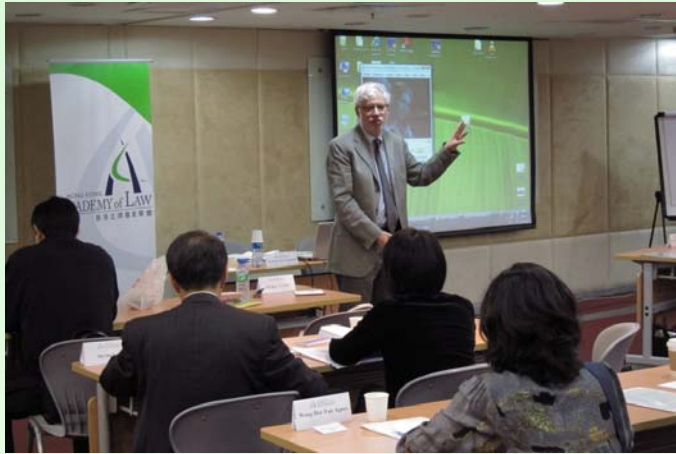
學會主辦的「調解代表訓練課程」於 5 月 17 至 18 日舉行，美國紐約 Touro 法律中心法律教授 Harold Abramson 先生應邀擔任講員。