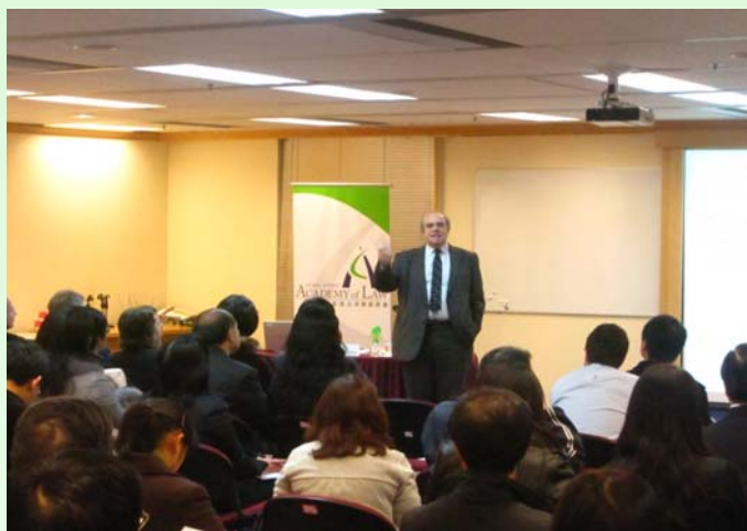
學會主辦的補充研討會於 3 月 11 日舉行，英國移民及難民分庭上級審裁庭副庭長 Mark Ockelton 法官應邀擔任其中一位嘉賓講者。

課程，而作為補充跟進，學會於 2011 年 3 月舉辦一項為期四小時的研討會。研討會吸引了超過 140 人出席。